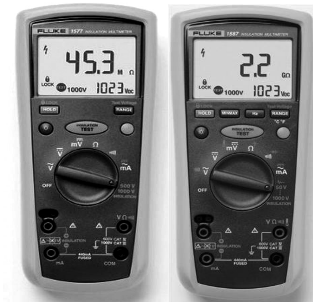
Рисунок 1 - Внешний вид мультиметров – мегаомметров Fluke 1577 (слева) и Fluke 1587 (справа).

Конструктивно мультиметр выполнен в ударопрочном пылезащитном корпусе и представляет собой портативный цифровой прибор. Внешний вид мультиметров представлен на рисунке 1.